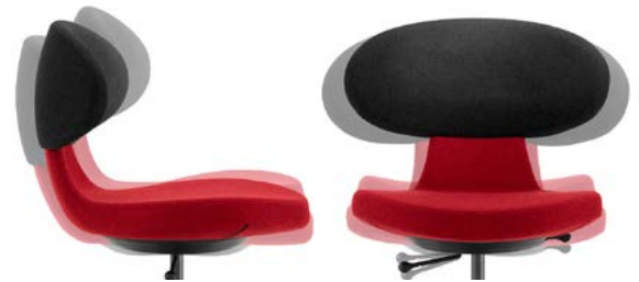
_1 3D Bewegungsmechanik Mécanisme de mobilité 3D