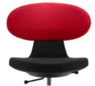
_2 bicolor bicolore